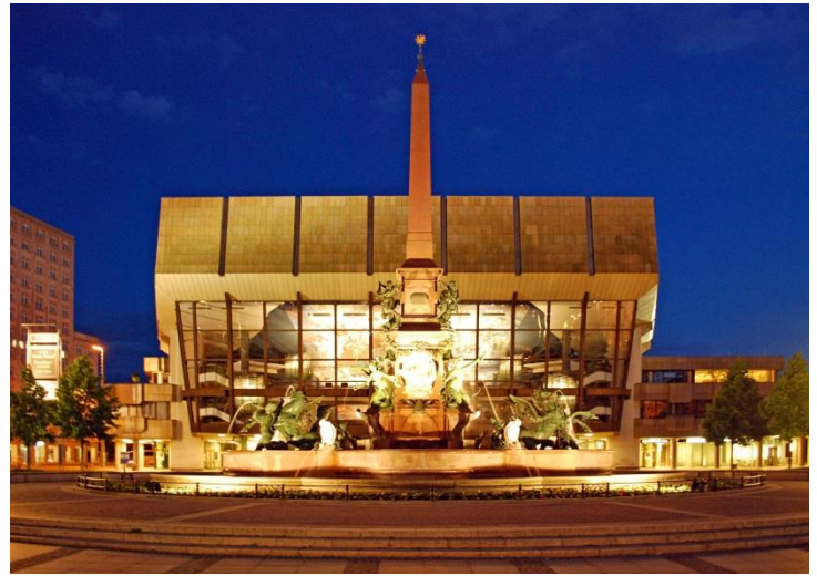
Gewandhaus und Mendelbrunnen bei Nacht