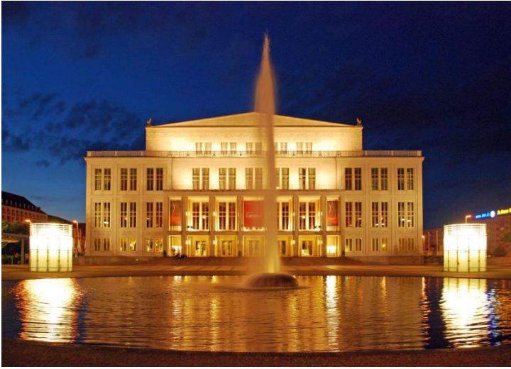
Opernhaus Leipzig

Rossinis „Reise nach Reims“ im Opernhaus Leipzig Herbert Blomstedt und das Gewandhausorchester im Gewandhaus Thomanerchor mit Motette in der Thomaskirche 04.04.-07.04.2025